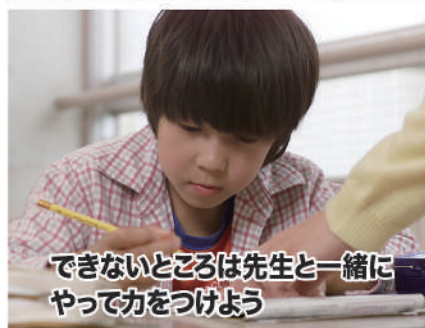
できないところは先生と一緒にやって力をつけよう