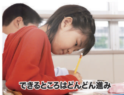
できるところはどんどん進み

小学生の時にはいろいろな習い事をして、勉強は中学生になってからがんばる、とお考えのお母さん、もちろんそれとても大切。でも、勉強の本当の基本は小学校で身に付きます。小学校で習う漢字が書ければ、難しい漢字だって、すべてその組み合わせ。算数だって、小数・分数・速さと時間・割合と百分率・比の利用と、中学生になって難しいところの基本はすべて小学校で習います。都道府県名や歴史の流れなども小学校で学習し、中学校ではそれを基にして学習を進めていきます。小学校の学習をおろそかにして、中学から急に勉強しようとしても、わからないことがいっぱい勉強が嫌いになってしまいます。小学生のうちから楽しく勉強して、これからの学習に役立てましょう。